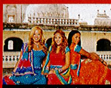
Prêtes à faire des étincelles...

TÉLÉFILM. Les New-Yorkaises Aqua, Chanel, Galleria et Dorinda rêvent de devenir des pop stars. Elles s'envolent pour Barcelone, où un concours est organisé. Une comédie musicale réussie menée par la volcanique Raven-Symoné.