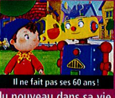
Il ne fait pas ses 60 ans!

DESSIN ANIMÉ. Pour ses 60 ans, le célèbre pantin de bois revient dans de nouvelles aventures. Ses amis sont toujours là, tout comme Finaud et Sournois, mais il y a du nouveau dans sa vie. En plus de son taxi rouge, le gentil bonhomme pilote un hydroglisseur, un 4x4 ou un hélico.