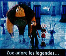
Zoé adore les légendes...

FILM. Toutes les trente saisons, Bouffe-Monde le dragon revient et il ne laisse derrière lui que le néant. Pour en venir à bout, Zoé, la nièce du seigneur Arnold, va recruter Lian-Chu, un colosse aimant le tricot, et Gwizdo, un petit arnaqueur.